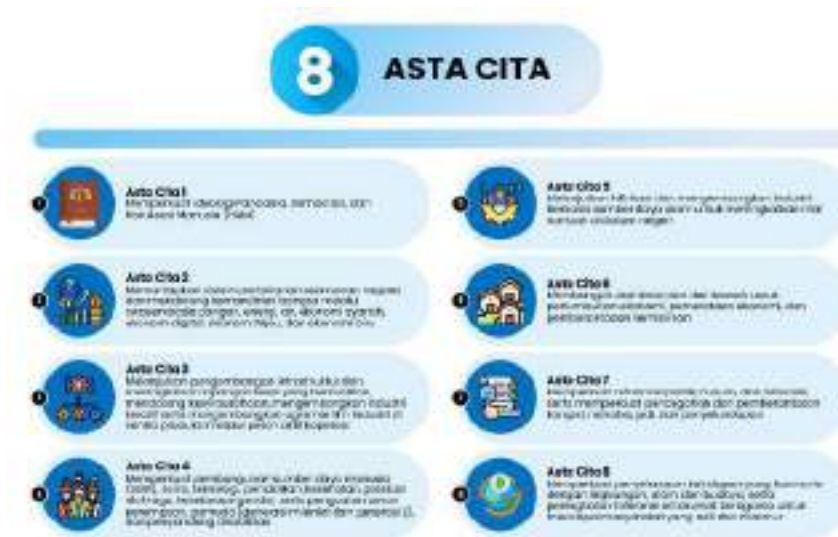
Gambar 3.1 Delapan Misi (Asta Cita)

Untuk mewujudkan Visi Presiden dan Wakil Presiden dijabarkan kedalam delapan Misi (Asta Cita) yaitu: