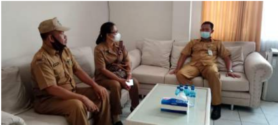
Dinas Kominfosanti yang diwakili oleh Kabid PLIP dan Kasi Layanan Informasi Publik Melakukan monitoring ke Dinas Kesehatan Kab. Buleleng terkait e-monev Keterbukaan Informasi Publik