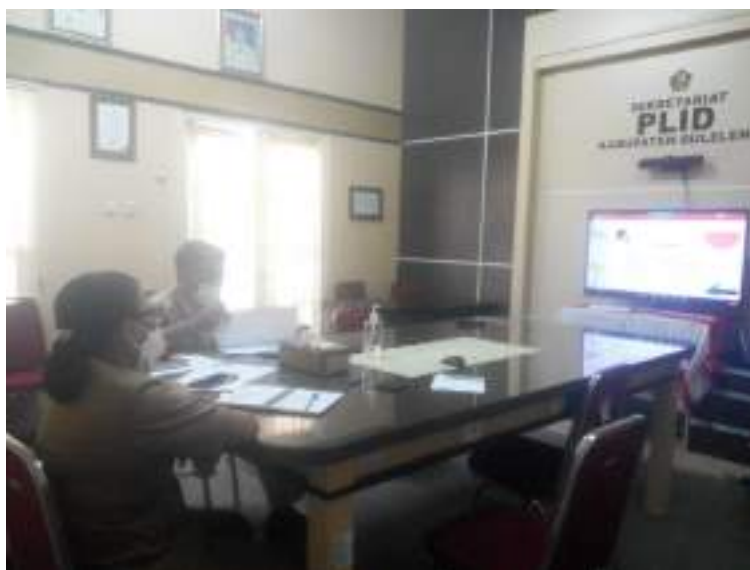
Mengikuti zoom meeting yang dilaksanakan oleh Kementrian Kominfo terkait PPID yang diikuti oleh Sekdis Dinas Kominfosanti dan Kabid PLIP