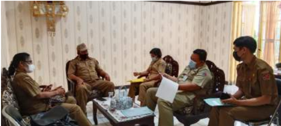
Dinas Kominfosanti yang diwakili oleh Kabid PLIP dan Kasi Layanan Informasi Publik Melakukan monitoring ke Dinas PMD Kab. Buleleng terkait e-monev Keterbukaan Informasi Publik