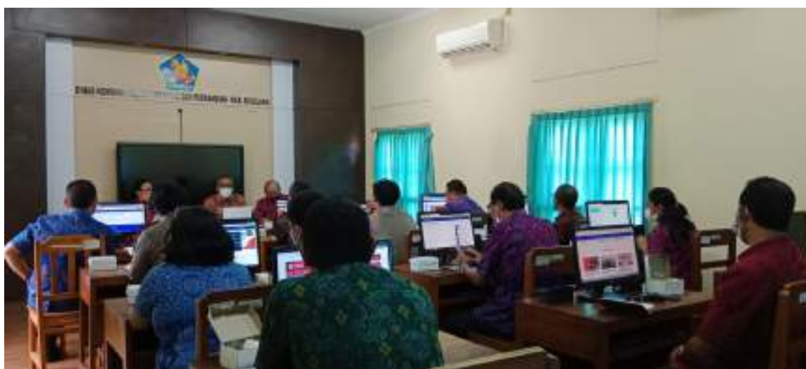
Rapat yang diadakan di ruang Lab Dinas Kominfosanti yang diikuti oleh 12 OPD terkait penyamaan persepsi pengisian jawaban e-monnev Keterbukaan Informasi Publik