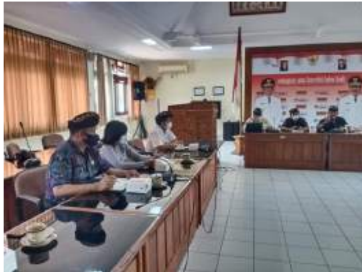
Bimtek website SiKI di Dinas Kominfo Provinsi