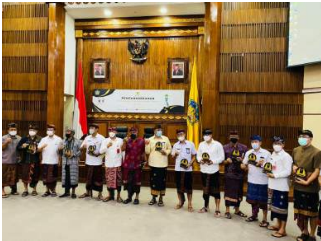
Dinas Kominfosanti menghadiri penghargaan Keterbukaan Informasi Publik yang dilaksanakan oleh Komisi Informasi Provinsi Bali