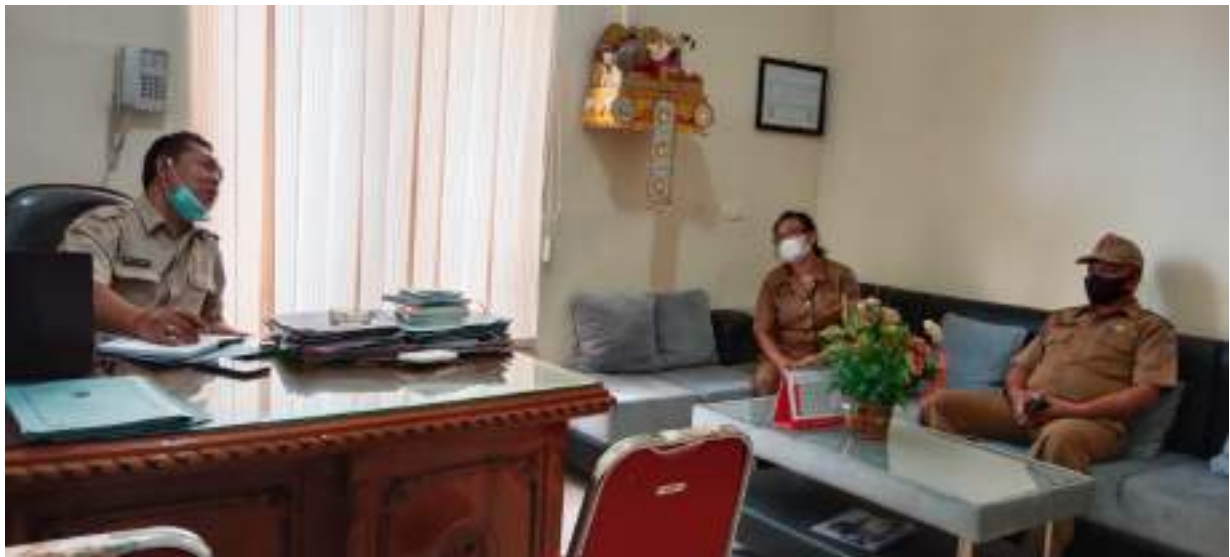
Dinas Kominfosanti yang diwakili oleh Kabid PLIP dan Kasi Layanan Informasi Publik Melakukan monitoring ke Dinas PUTR Kab. Buleleng terkait e-monev Keterbukaan Informasi Publik