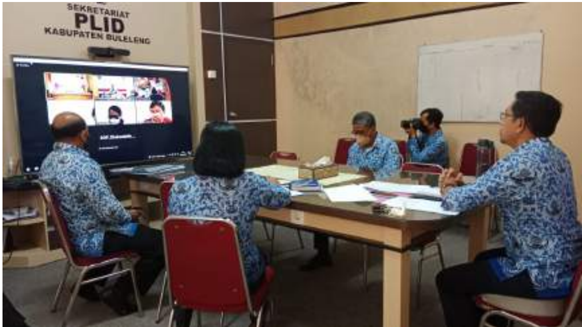
Dinas Kominfosanti Mengikuti E-Monev Terkait Keterbukaan Informasi Publik Yang Dilaksanakan Oleh Komisi Informasi Secara Daring Di Ruang Rapat Dinas Kominfosanti