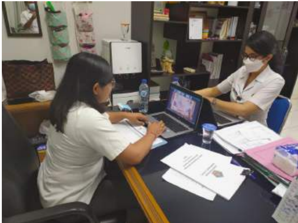
BPKPD Kab. Buleleng mengikuti E-Monev Terkait Keterbukaan Informasi Publik Yang Dilaksanakan Oleh Komisi Informasi Secara Daring Kominfosanti