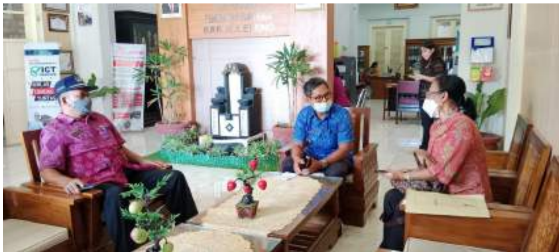
Dinas Kominfo yang diwakili oleh Kabid PLIP dan Kasi Layanan Informasi Publik Melakukan monitoring ke Dinas Pendidikan Kab. Buleleng terkait e-money Keterbukaan Informasi Publik