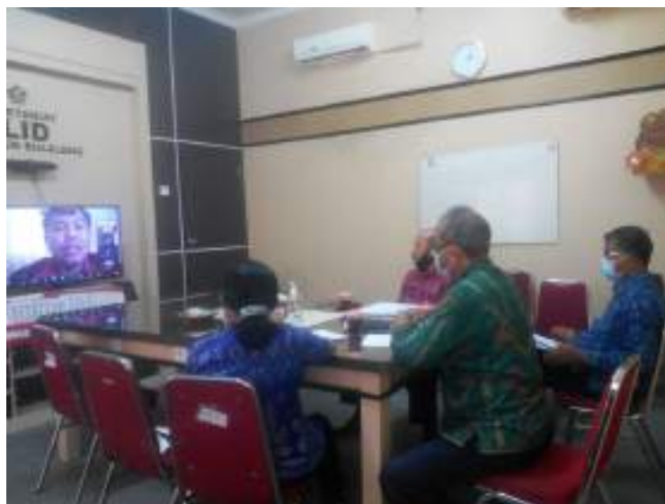
Melaksanakan zoom meeting yang diikuti oleh semua PPID Pembantu terkait pengisian website SiKI di ruang rapat Dinas Kominfosanti Kab. Buleleng