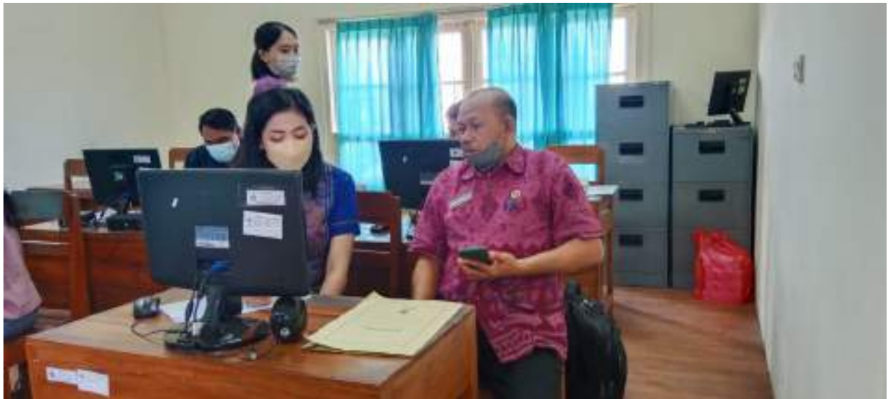
Dinas Kominfo yang diwakili oleh Kabid PLIP dan Kasi Layanan Informasi Publik Melakukan monitoring ke BPKPD Kab. Buleleng terkait e-money Keterbukaan Informasi Publik