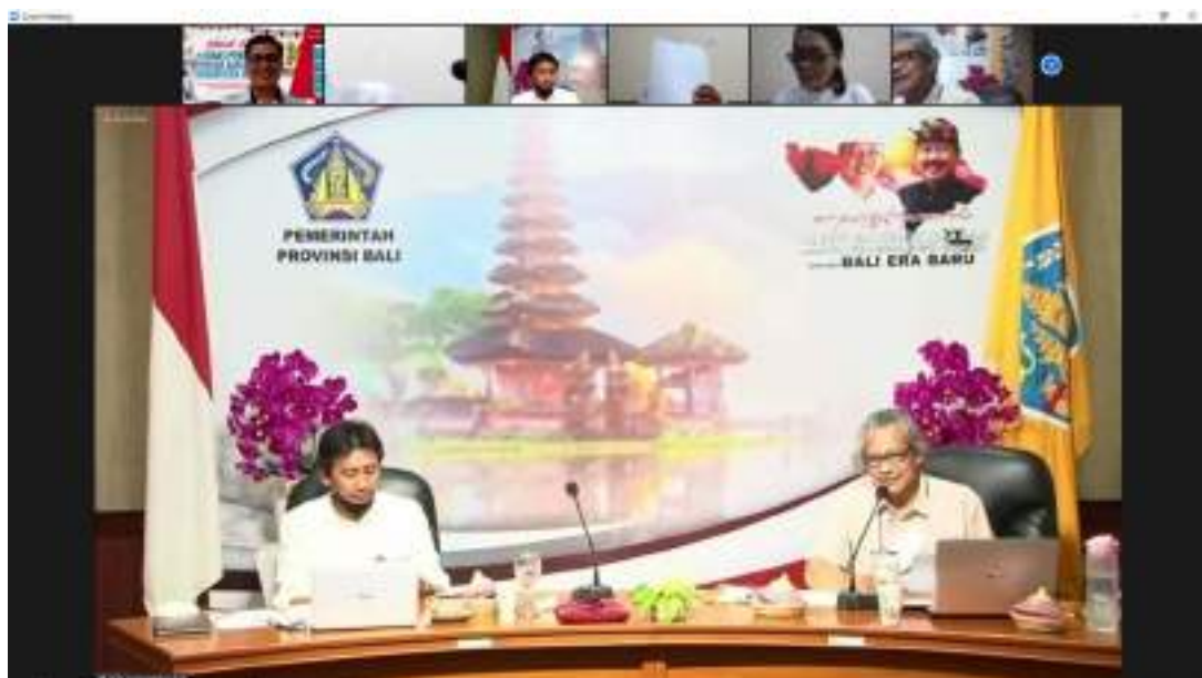
Dinas Pendidikan Kab. Buleleng mengikuti E-Monev Terkait Keterbukaan Informasi Publik Yang Dilaksanakan Oleh Komisi Informasi Secara Daring Kominfosanti