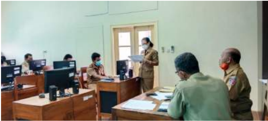
Rapat intern yang diadakan di ruang Lab Dinas Kominfosanti yang diikuti oleh masing-masing Bidang Dinas Kominfosanti