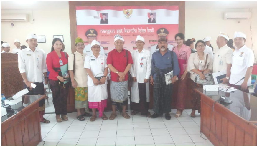
Technical Meeting pemeringkatan keterbukaan informasi publik, tanggal 2 Juli 2019 di ruang rapat Dinas Kominfo dan Statistik Denpasar