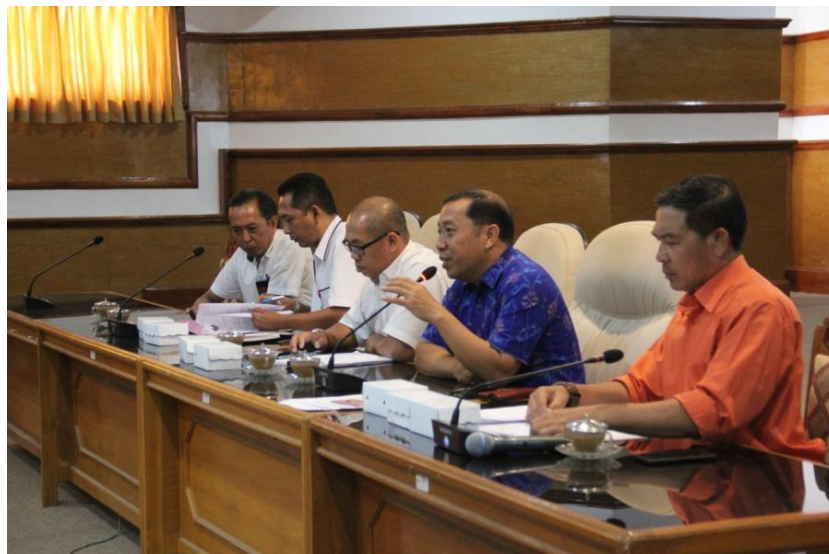
Komisi Informasi (KI) Bali melakukan visitasi ke Pemkab. Buleleng, tanggal 11 September 2019 di Gedung Unit IV Kantor Bupati Buleleng