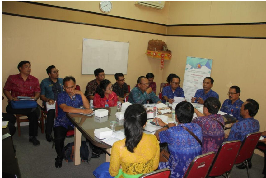
Rapat persamaan persepsi Monev Keterbukaan Informasi Publik yang diikuti oleh ke-12 peserta PPID Pembantu, tanggal 3 September 2019 di ruang rapat Dinas Kominfosandi Kab. Buleleng