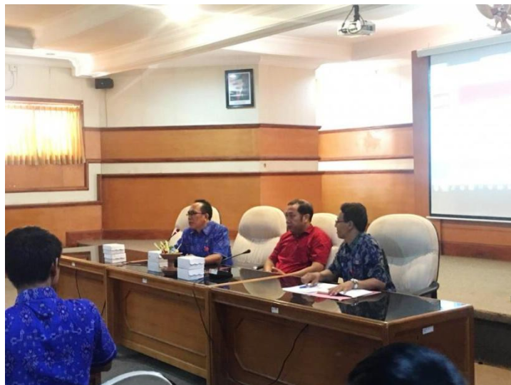
Sosialisasi mengenai pemahaman tentang Informasi yang di kecualikan yang diikuti oleh PPID Pembantu Pemkab Buleleng, tanggal 23 April 2019 di Gedung Unit IV Kantor Bupati Buleleng