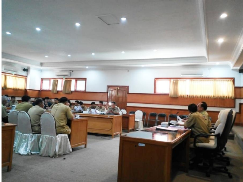
Pemaparan mengenai penjelasan umum pemeringkatan pelayanan publik, tanggal 15 Juli 2019 di Gedung Unit IV Kantor Bupati Buleleng