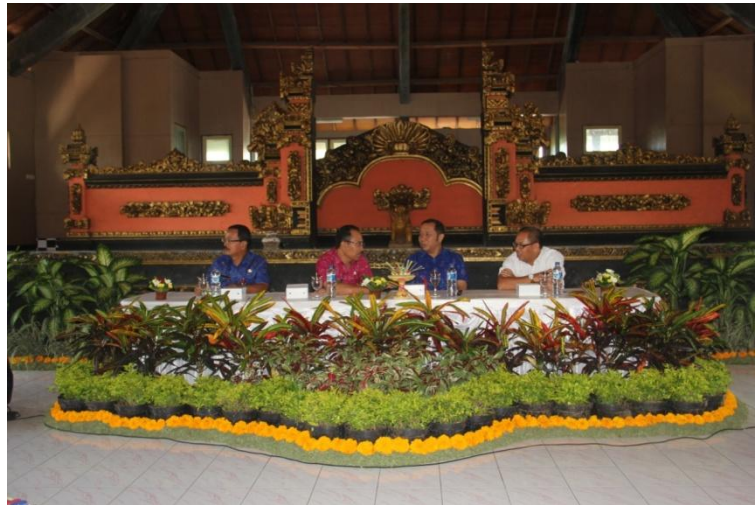
Sosialisasi PPID dan Pembentukan PPID Desa, tanggal 12 Februari 2019 di Gedung Wanita Laksmi Graha