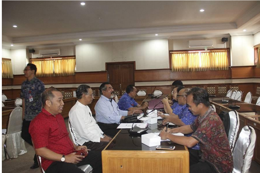
Asistensi Informasi yang dikecualikan yang diikuti oleh PPID Pembantu, tanggal 18 Juni 2019 di Gedung Unit IV Kantor Bupati Buleleng