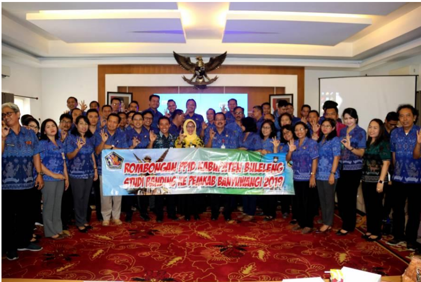
PPID Pemkab. Buleleng melakukan Studi Tiru ke Pemkab. Banyuwangi, tanggal 22 November 2019