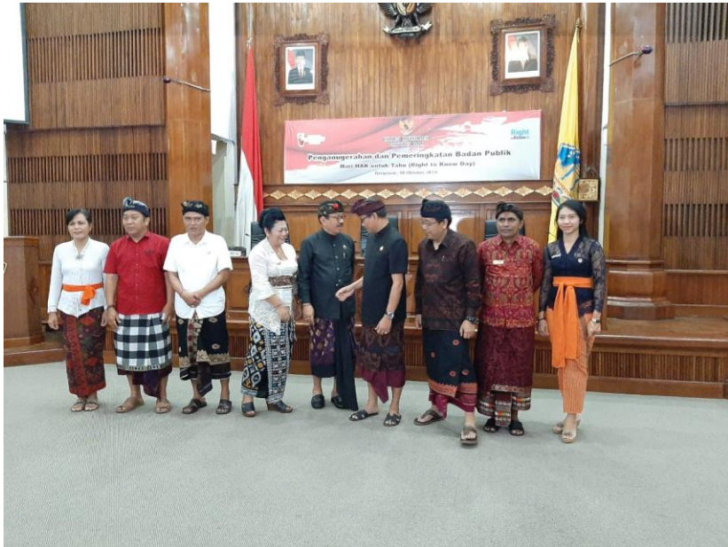
Penganugerahan dan Pemingkatan Badan Publik, tanggal 10 Oktober 2019 di Kantor Gubernur Bali