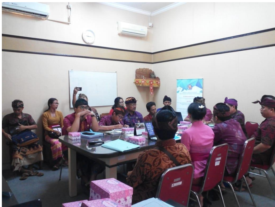
Rapat Pembahasan Persiapan Monev Keterbukaan Informasi Publik tahun 2019, tanggal 22 Agustus 2019 di Ruang Rapat Kominfosandi Kab. Buleleng